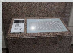
マンション共用玄関

マンションのオートロックシステムがロックマンジャパンの「GM-3000」であれば、部屋の玄関・共用玄関・勝手口（裏口）をすべて同じタグで解錠できます。GM-3000では専用の設定機で登録を行い、セキュリティの面でも安心です。